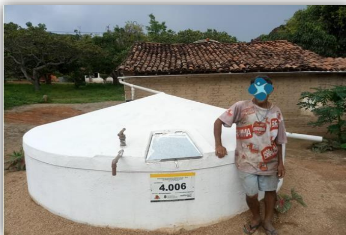
Foto 2 – Visualização do Sistema de Descarte, Filtro de Barro, Calha, Telhado e