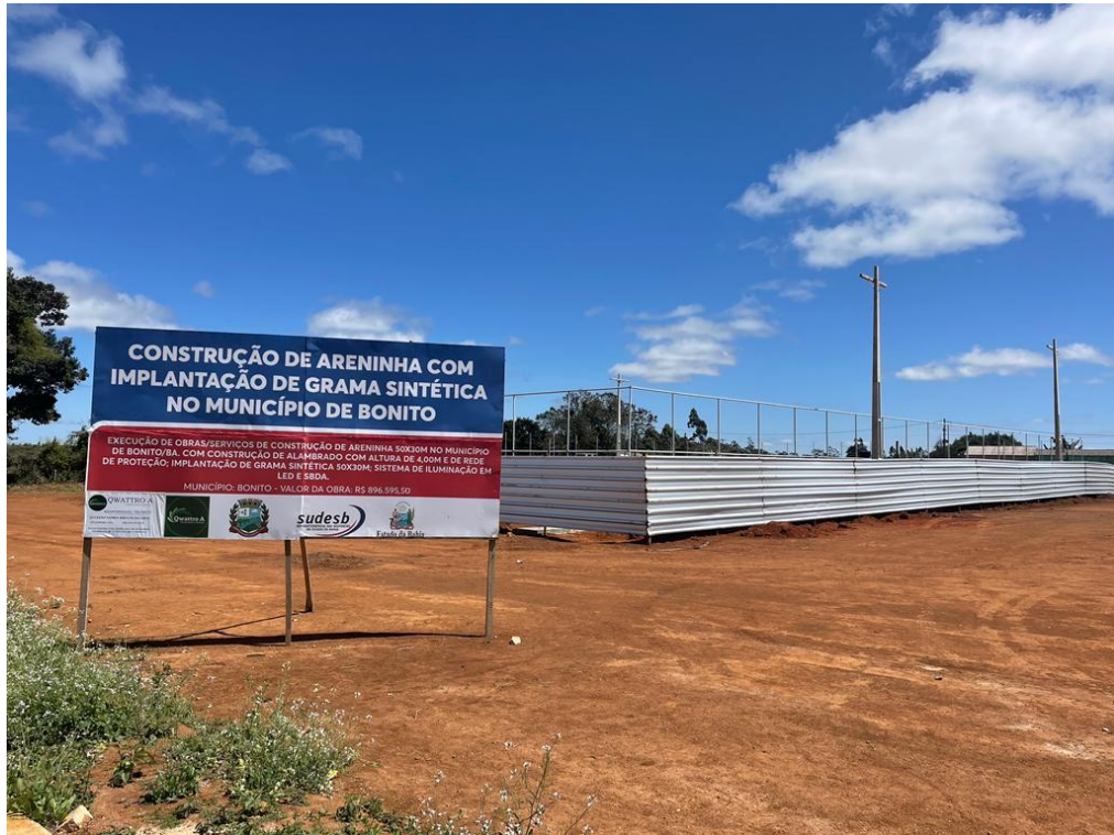
Foto 02 – Visão interna (construção de alambrado e instalação de postes para sistema de iluminação).

Foto 01 – Visão geral da área (placa de obra, tapume, construção de alambrado e instalação de postes para sistema de iluminação).