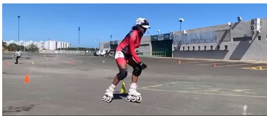
LOCAL DA COMPETIÇÃO