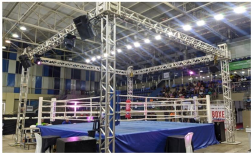
(GRID EM ESTRUTURA DE ALUMÍNIO/BANNER EM LONA FOSCA (FUNDO DE PÓDIO)/ILUMINAÇÃO/SONORIZAÇÃO)