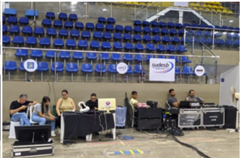
(LOCAÇÃO DE CADEIRA PLÁSTICAS/ LOCAÇÃO DE MESAS/GRADES DE CONTROLE)