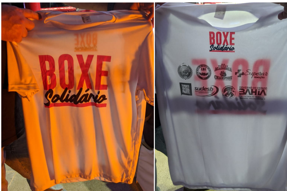
(CAMISA DO EVENTO EM MALHA PV, 67% POLIESTER, 33% DE VISCOSE, GOLA BÁSICA)