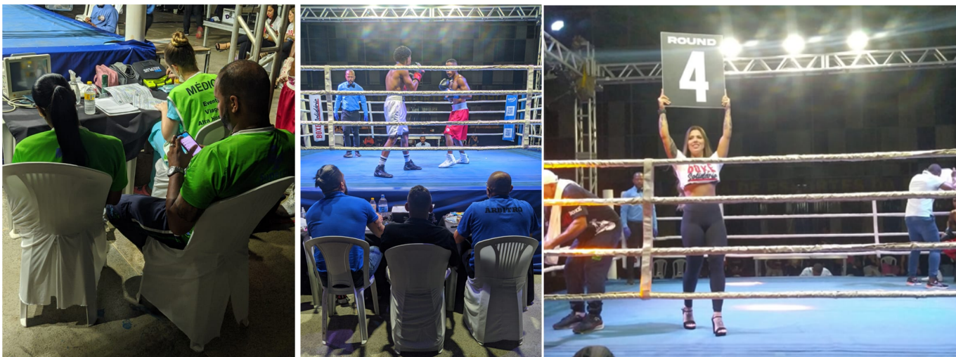
(APOIO OPERACIONAL/EQUIPE MEDICA) MATERIAL PROMOCIONAL