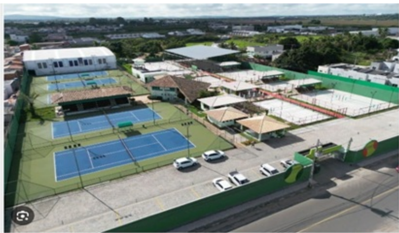
Academia de Beach Tennis e Tênis Smash