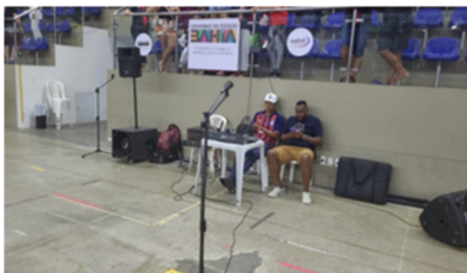
SONORIZAÇÃO / TROFÉUS MEDALHAS