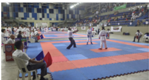
MARCAS + PÚBLICO + COMPETIÇÃO