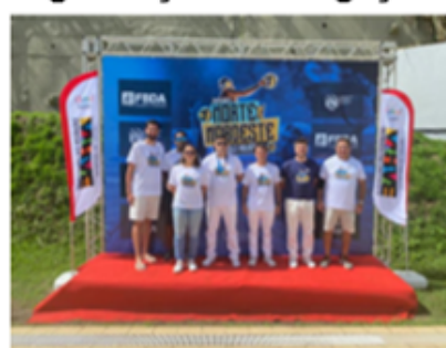
Organização e divulgação