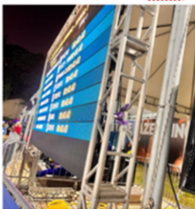
Telão e box truss