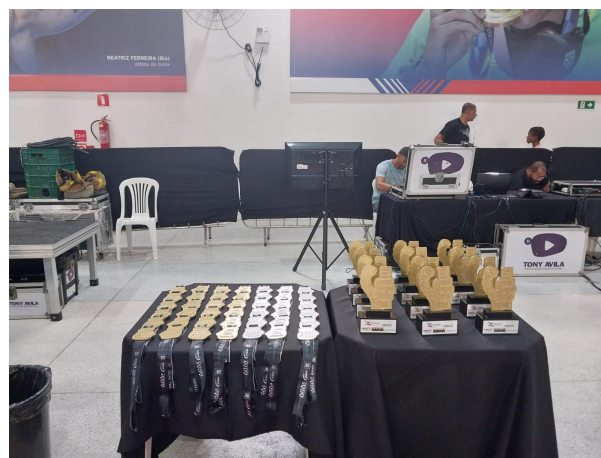
MEDALHAS/TROFÉUS E SONORIZAÇÃO