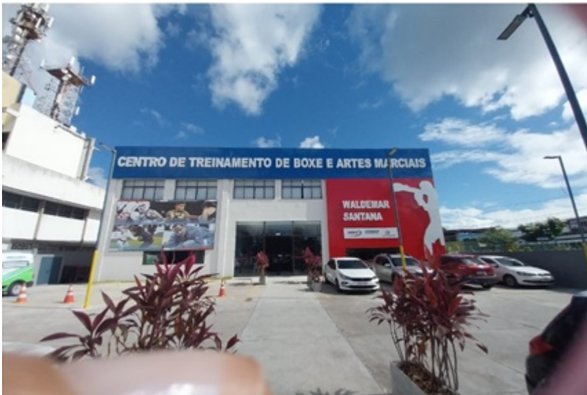
LOCAL DA COMPETIÇÃO