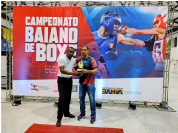
BOXTRUSS / PREMIAÇÃO