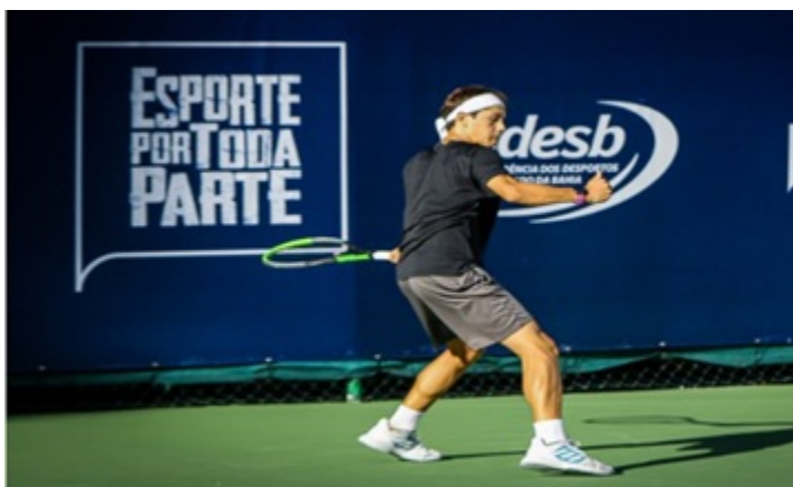
COMPETIÇÃO SUB-16-18 ANOS