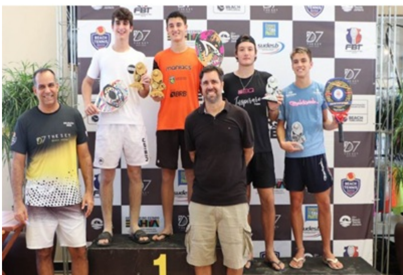
PREMIAÇÃO SUB-16-18 ANOS