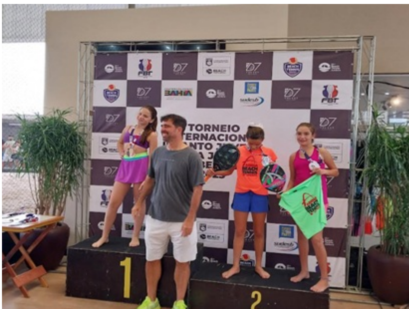
PREMIAÇÃO SUB 12-14 ANOS INDIVIDUAL