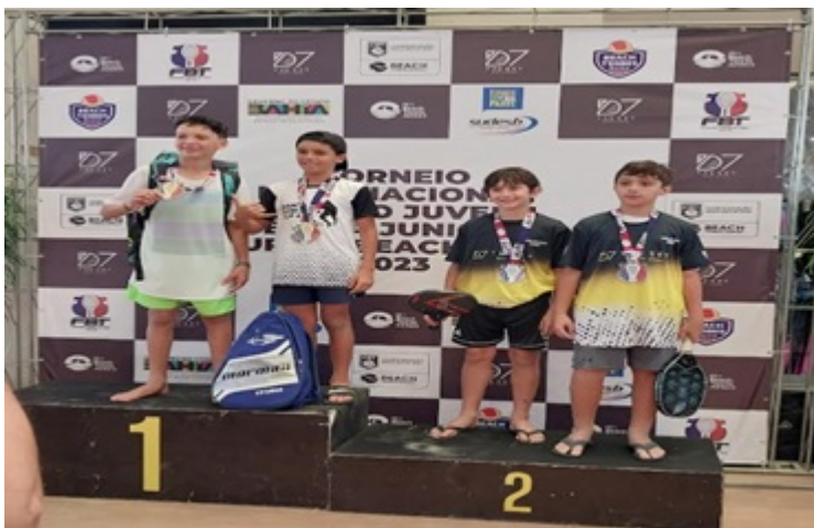
PREMIAÇÃO SIB-12- 14 ANOS DUPLA