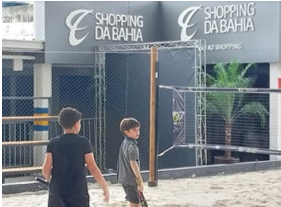
COMPETIÇÃO SUB 12- 14 ANOS