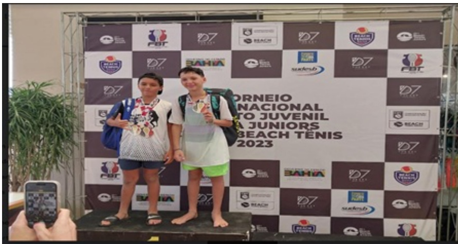
PREMIAÇÃO SUB 12- 14 ANOS MASCULINO