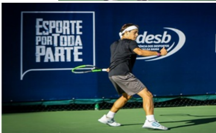
COMPETIÇÃO SUB 16 A 18 ANOS