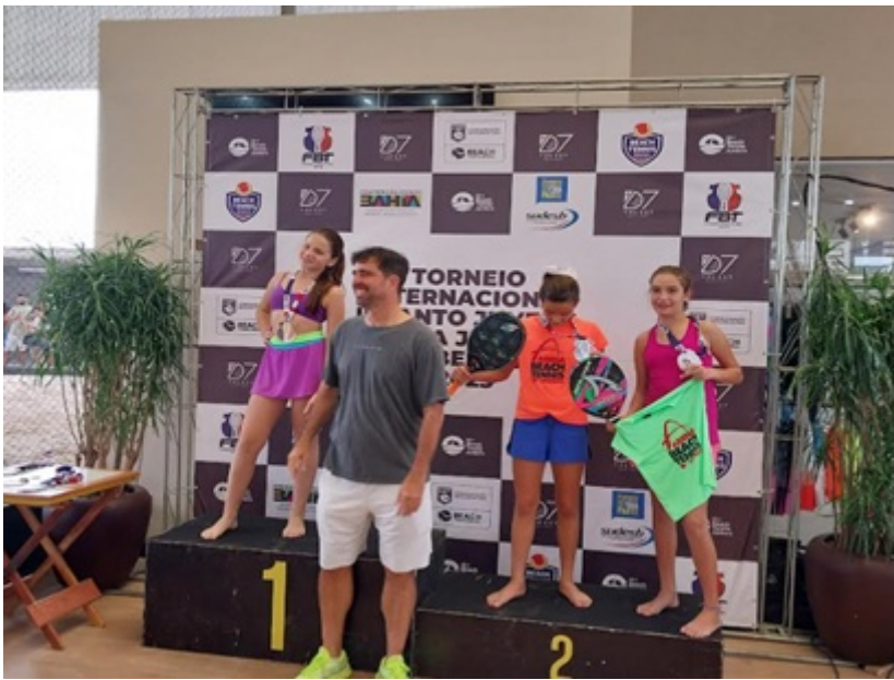
PREMIAÇÃO SUB 12-14 ANOS FEMININO