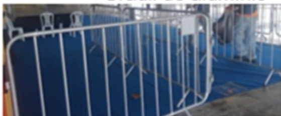
Gradil de alumínio