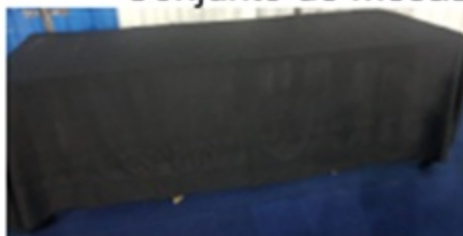
Conjunto de mesas