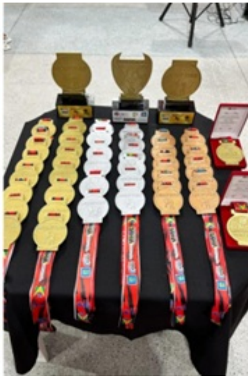
SEMINÁRIO TÉCNICO PESSOA COM DEFICIÊNCIA: I ETAPA