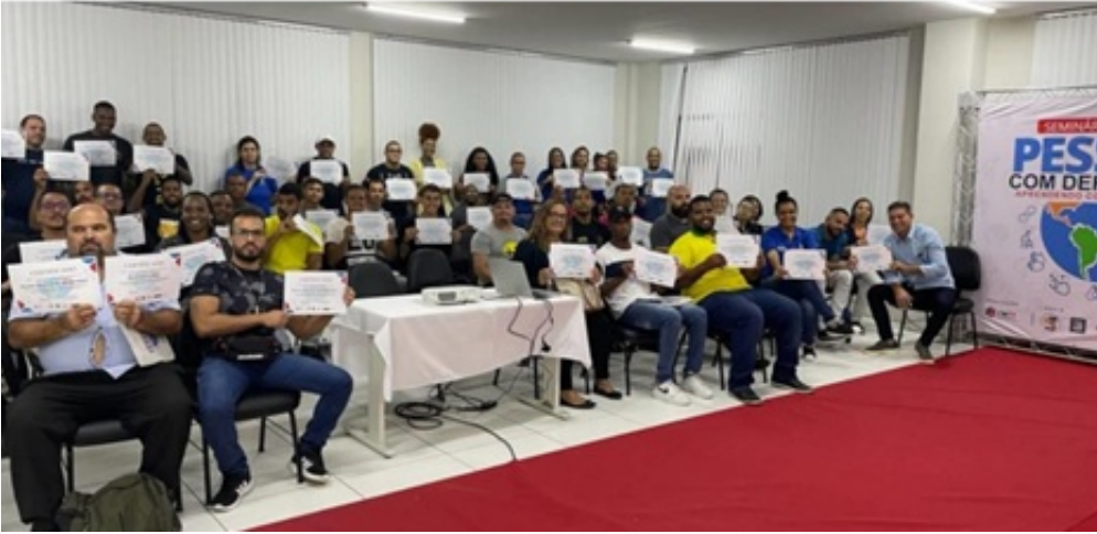
SEMINÁRIO TÉCNICO PESSOA COM DEFICIÊNCIA: II ETAPA