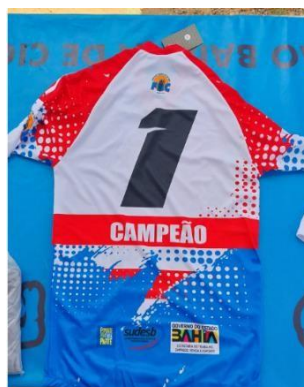
CAMISA DO ATLETA - CAMPEÃO