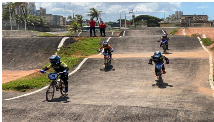
LOCAL DO EVENTO-PISTA TERTULIANO TORRES- PITUAÇU