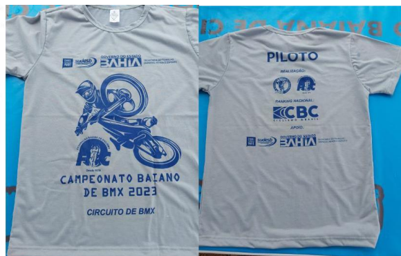
CAMISA DO ATLETA