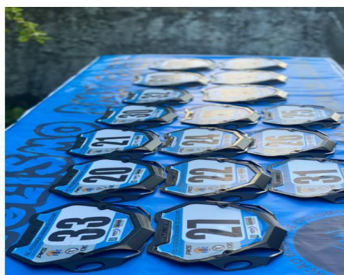
PLACA DE IDENTIFICAÇÃO