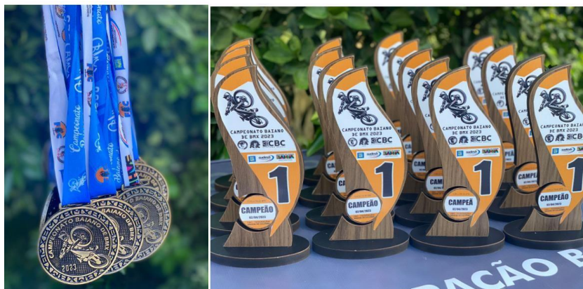
MEDALHAS E TROFÉUS