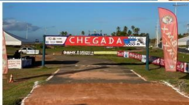
PÓRTICO DE LARGADA/ CHEGADA