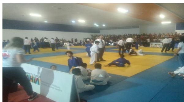
Super Etapa de Judô. Juazeiro/BA 28 e 29/07/2023