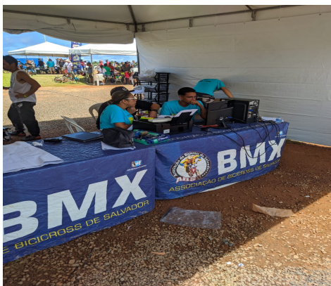
Mesa de premiação Premiação