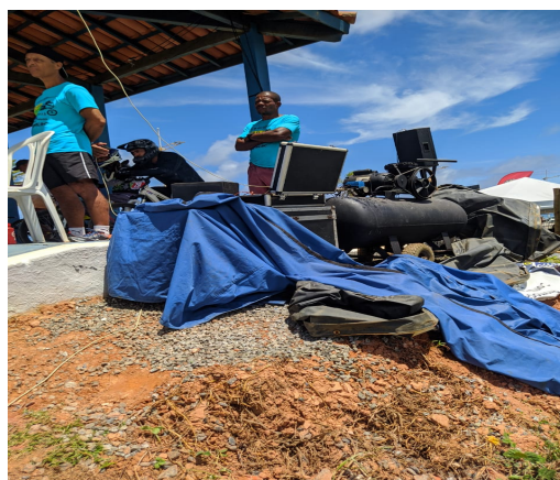
Arquibancada Toldo pirâmide (concentração dos atletas)