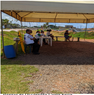
Banner de Divulgação Cerca baixa