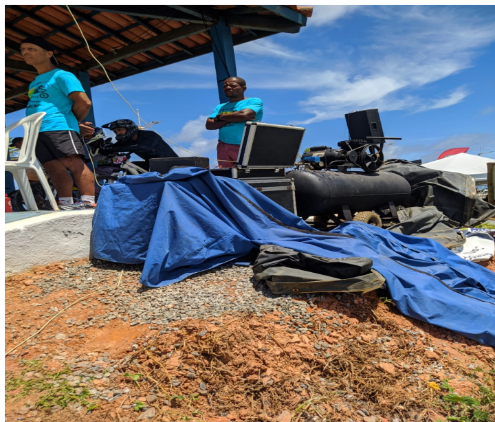
Arquibancada Toldo pirâmide (concentração dos atletas)