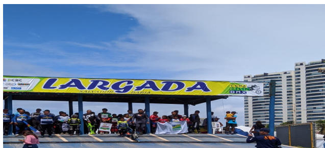
Estrutura de Largada