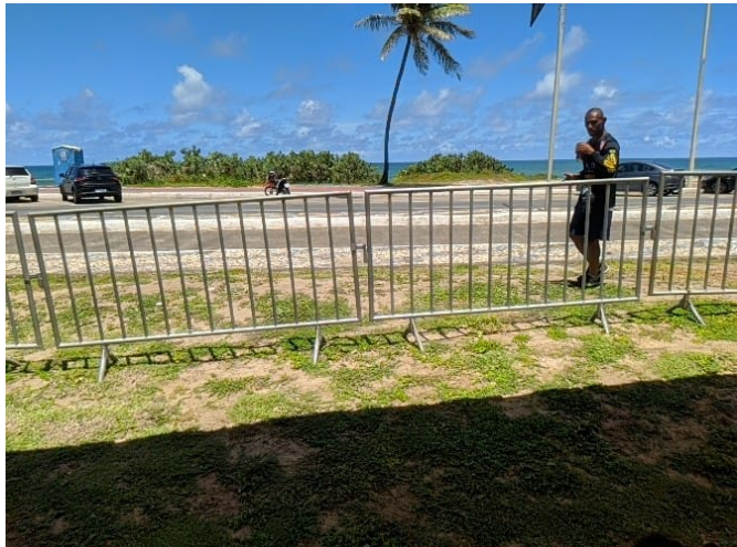
Pessoal de apoio Brinde