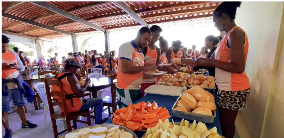
CAFÉ DA MANHÃ