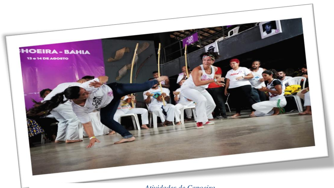
Atividades de Capoeira