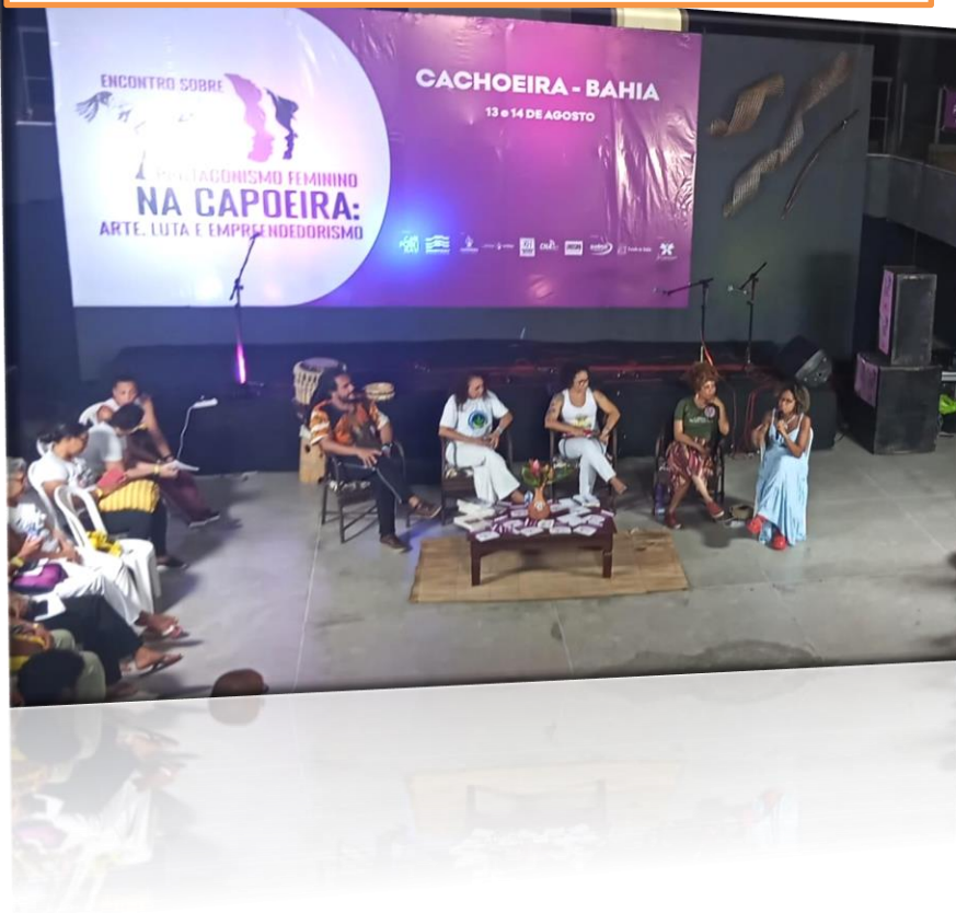
Registro de uma das mesas temáticas do evento