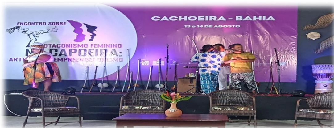
Registro do espaço de realização do evento e preparação da apresentação da Orquestra de Berimbau