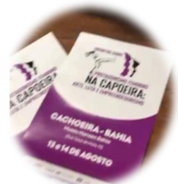
Cartilha do Projeto