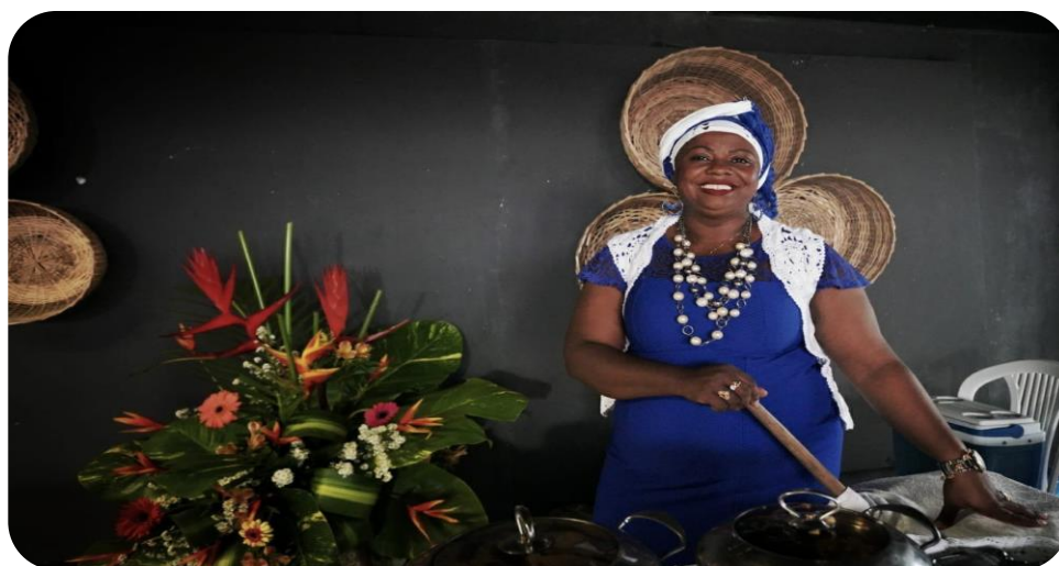
Culinária, Arte e Empreendedorismo