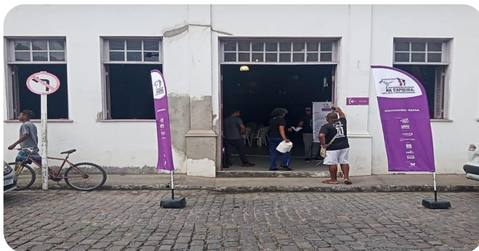
Registro de wind banner disponibilizado na entrada do local do evento.

Conforme descrito no plano de trabalho foi realizado a divulgação do projeto ocorrendo a confecção dos materiais promocionais, das peças gráficas, do Banner2/3, conforme indicado no item 2.2.2, ocorrendo a distribuição de camisetas e calças em consonância com a previsão de receitas e despesas.