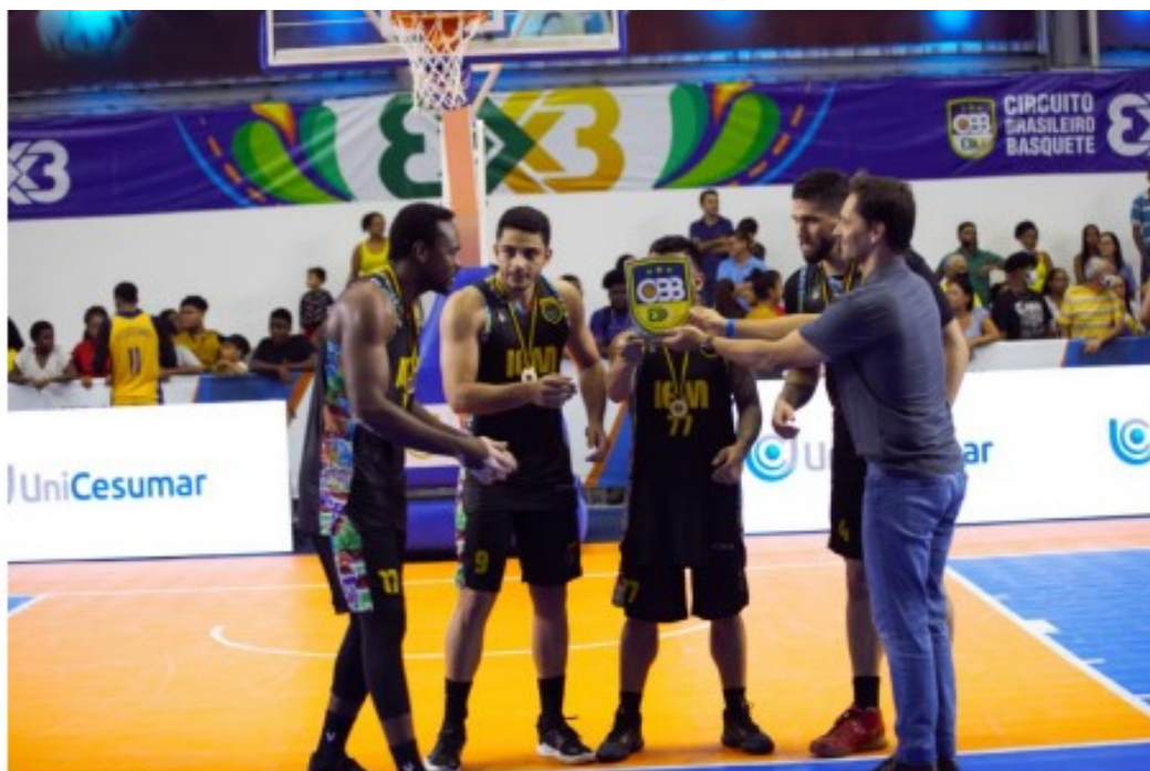
Instituto Edu Mariano