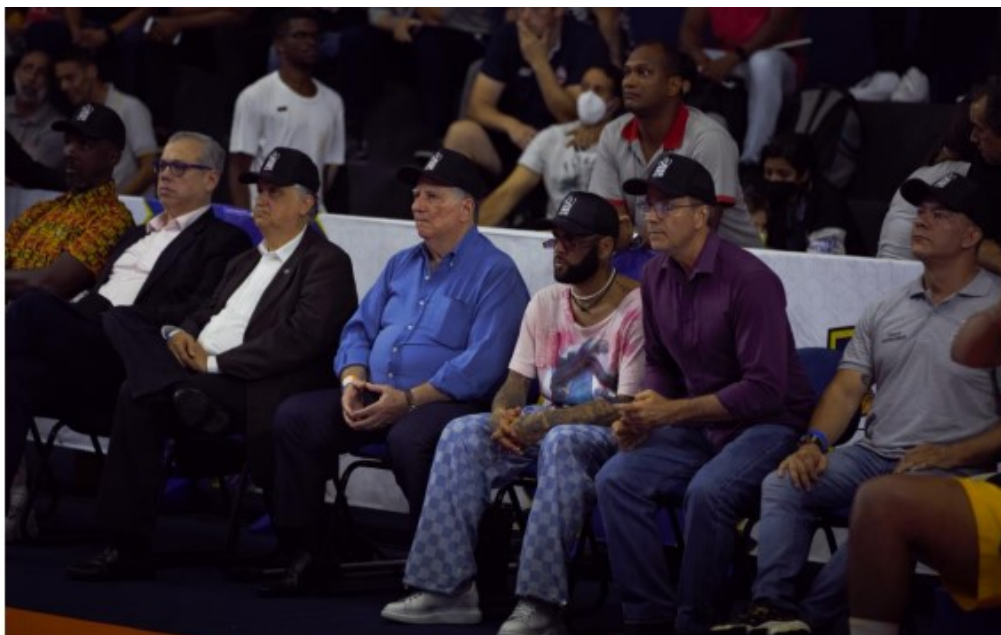
Representantes e autoridades