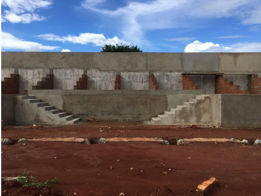
Foto 04 - Vista do sanitário Bar.