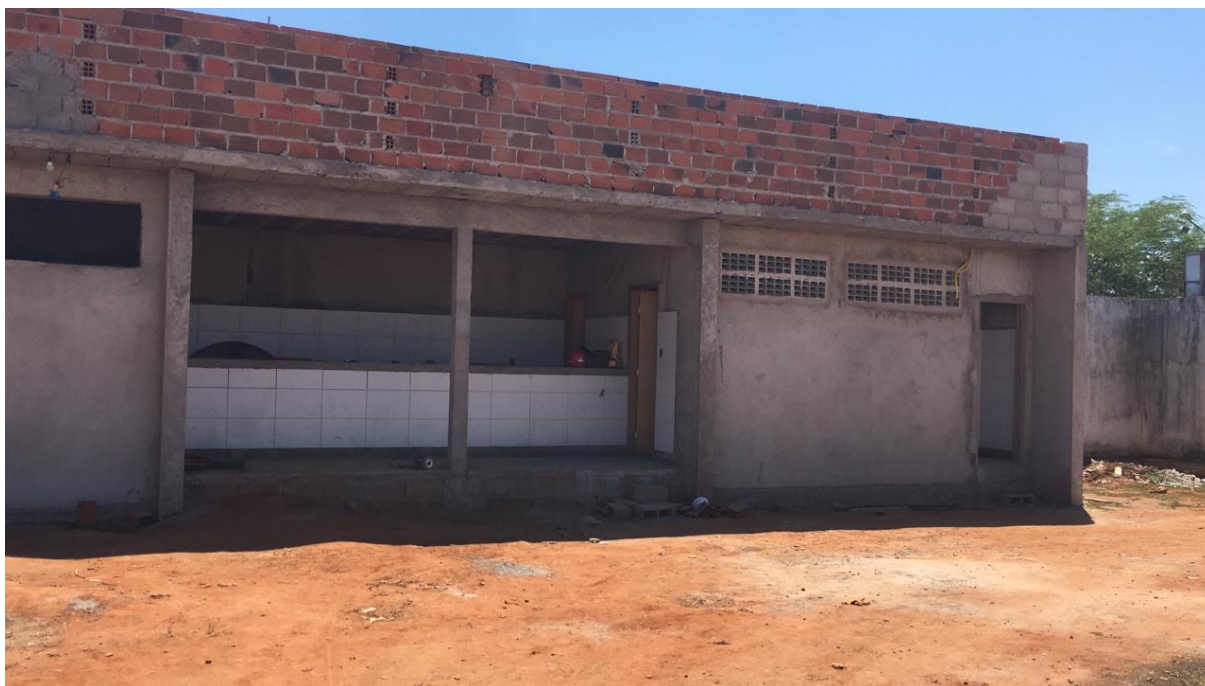
Foto 04 - Vista interna do sanitário Bar.