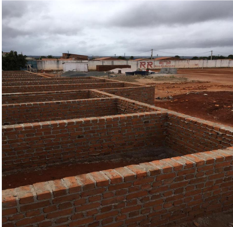
Foto 02 - inicio do revestimento da arquibancada .