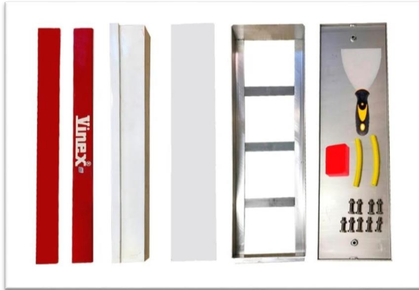
FIGURA 2 - KIT DE TÁBUAS DE IMPULSÃO COM INDICADOR EM PLASTICINA