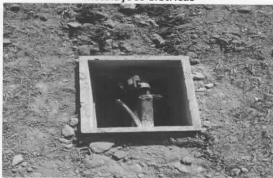
Foto 09 – Execução de caixas de passagem das instalações elétricas