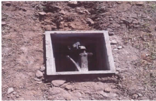
Foto 09 – Execução de caixas de passagem das instalações elétricas