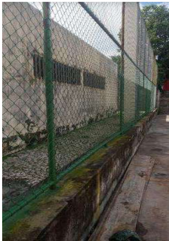
Foto 02 - Revisão do alambrado