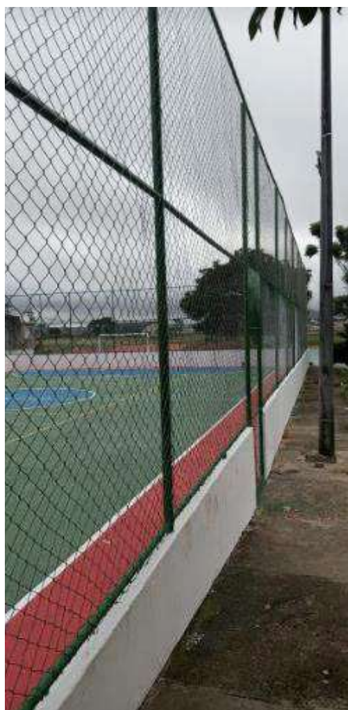
Foto 03- Revisão das esquadrias