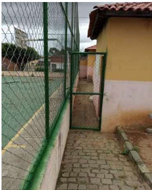
Foto 02 - Reforma do alambrado