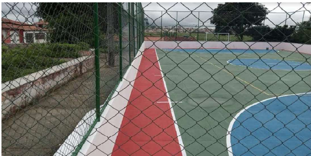
Foto 02 - Revisão da alambrado