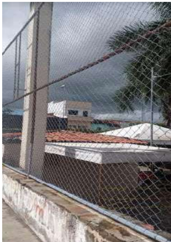
Foto 03 - Revisão das traves