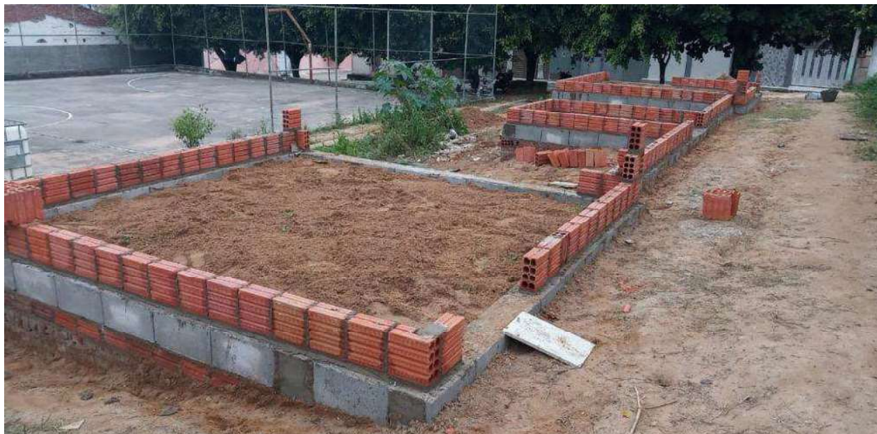
Foto 02 - Aterro para nivelamento do campo.