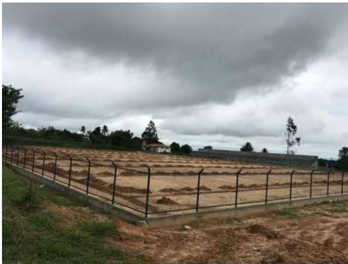
Foto 05 – Vista parcial destacando a arquibancada, o alambrado e os trabalhos do gramado em execução