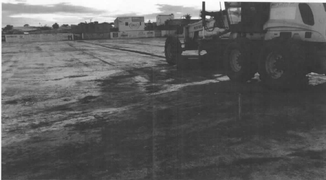
Foto 02 – Vista parcial destacando os serviços de movimento de terra e preparação do solo.