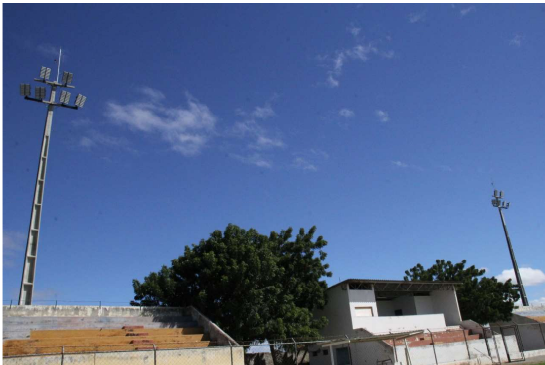
Foto 02 - Vista do poste com refletores em LED