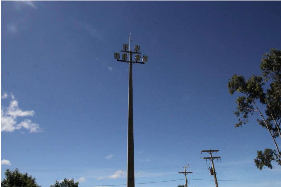
Foto 03 - Vista do poste com refletores em LED