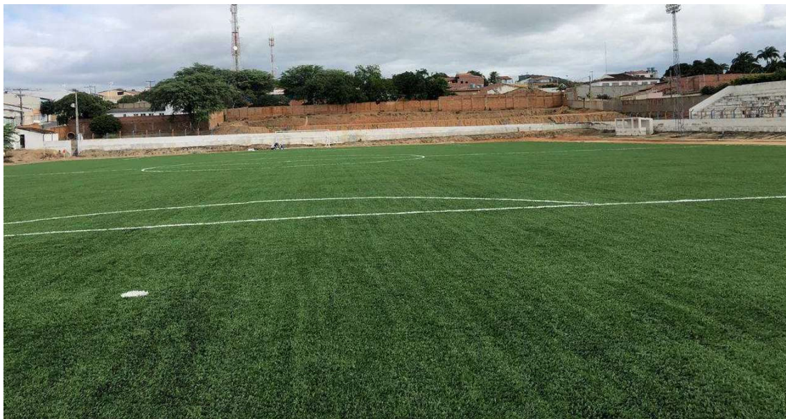
Foto 02 - campo em grama sintética com traves e demarcação