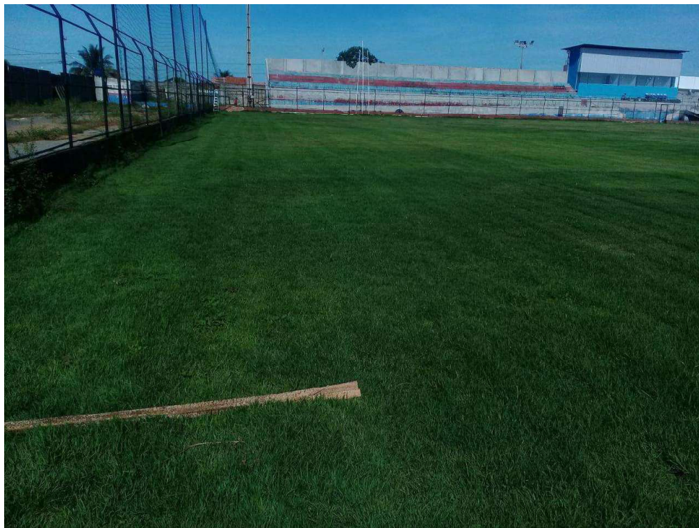
Foto 04 - Vista externa do modulo e vestiário