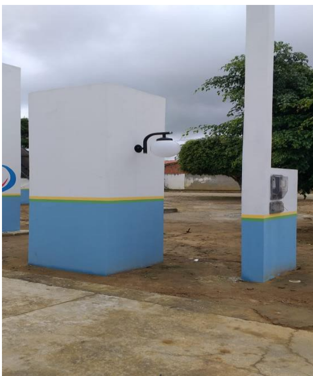
Foto 03 - Placa de Inauguração