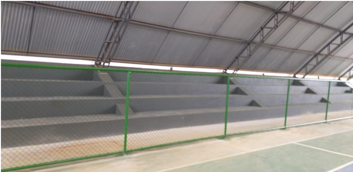
Foto 07 - Instalação dos Equipamentos esportivos