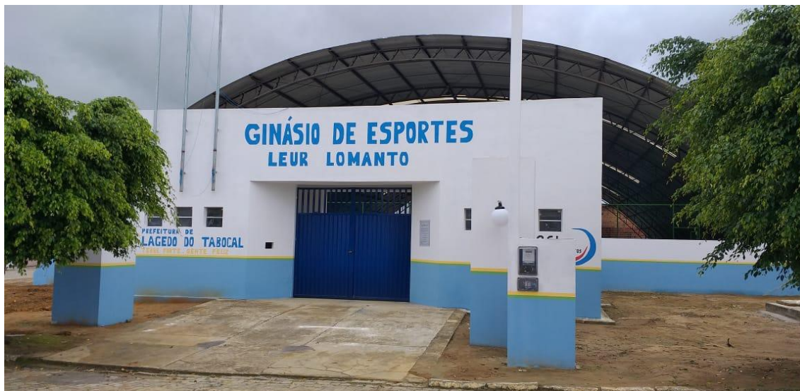
Foto 02 - Toten de Iluminação