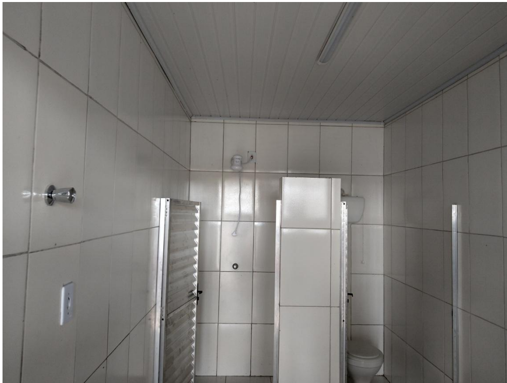
Foto 04 - Serviços de esquadrias e pintura