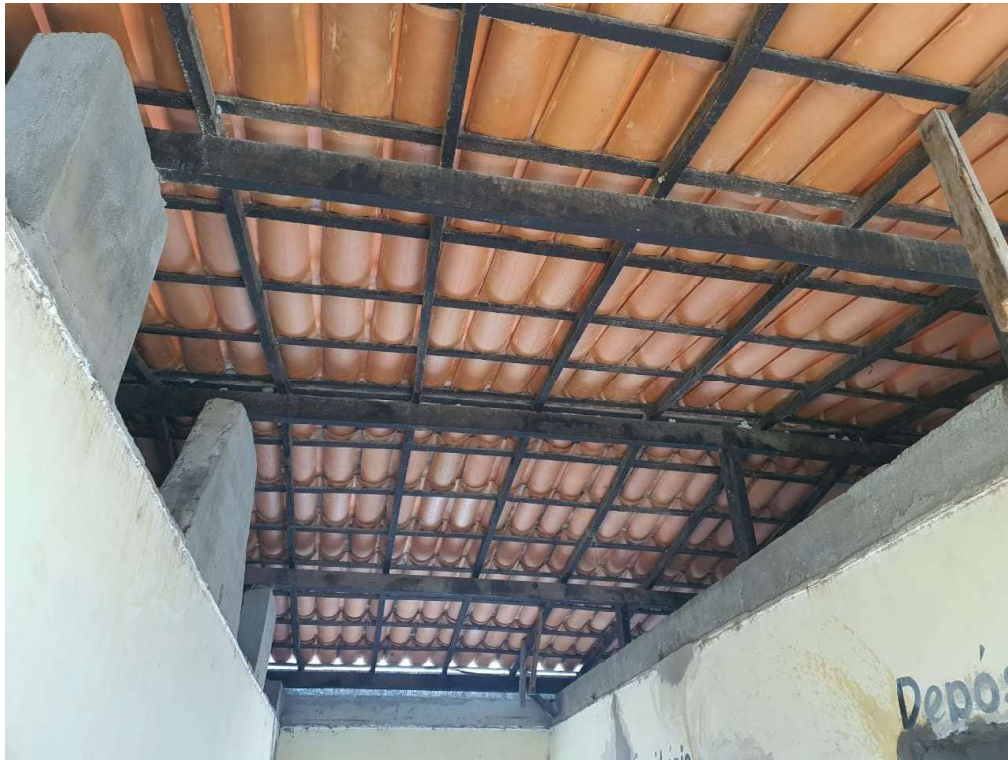
Foto 04 - Execução do revestimento cerâmico.