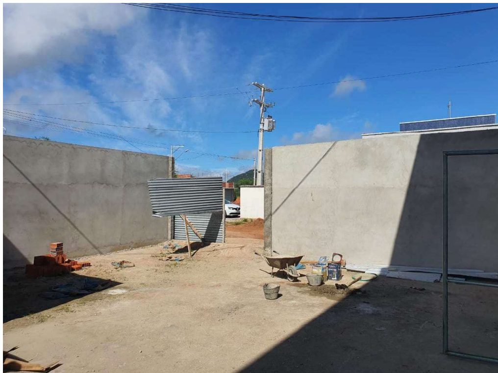
Foto 02 - Recuperação da Arquibancada.