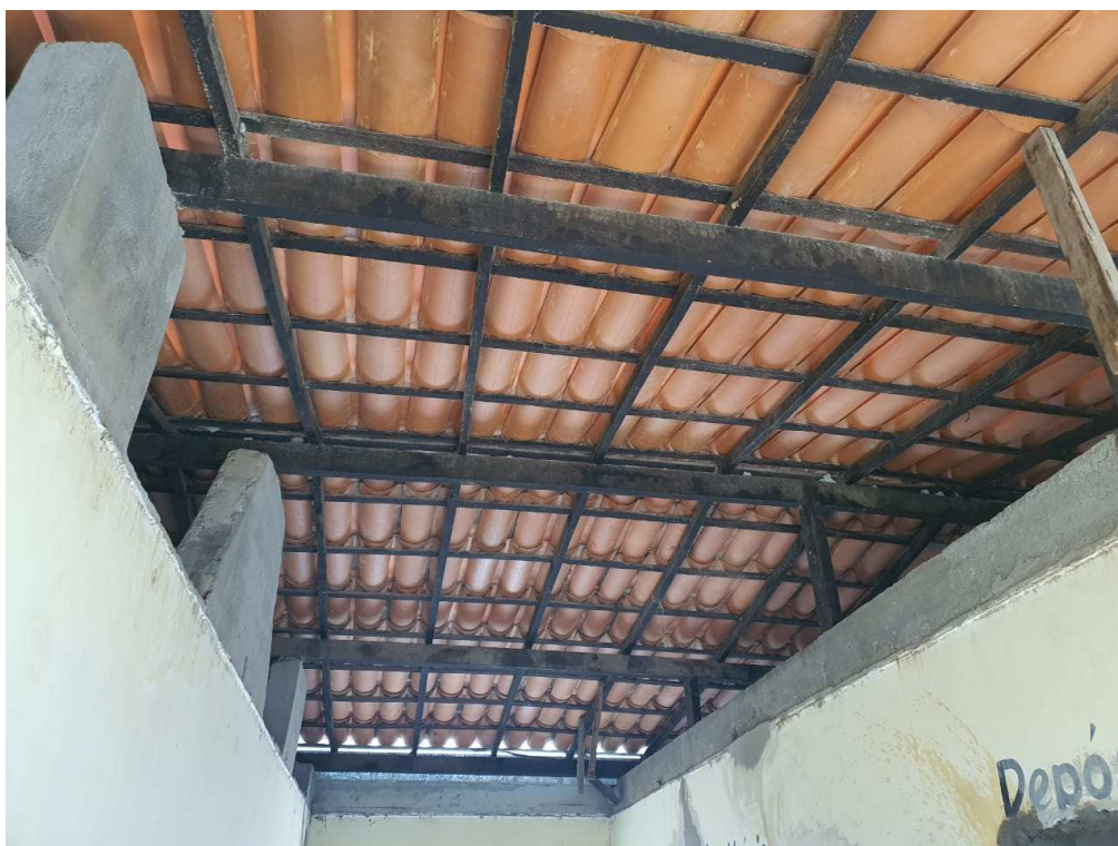
Foto 04 - Execução do revestimento cerâmico.