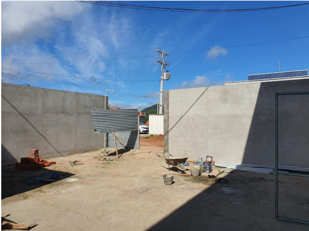
Foto 02 - Recuperação da Arquibancada.