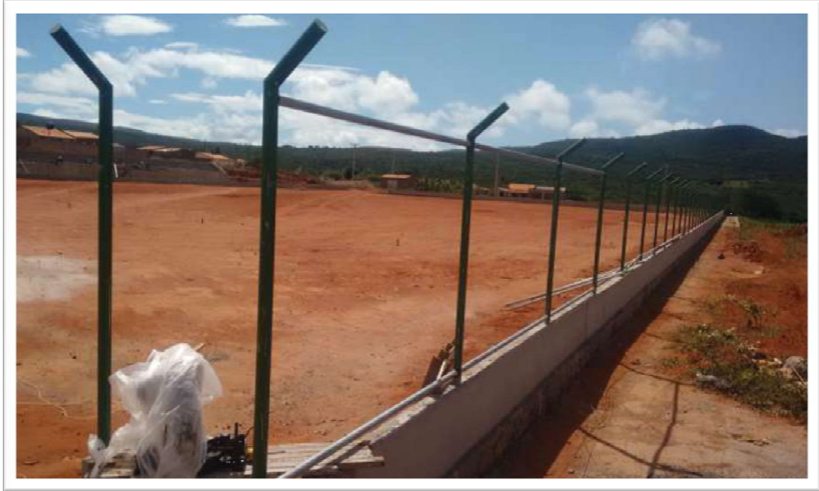
Foto 03 - Execução da Arquibancada