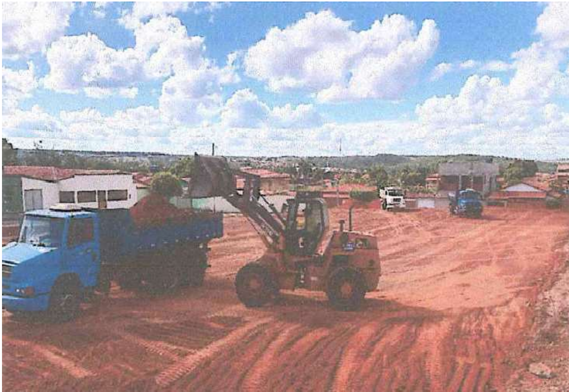
Foto 02 - Nivelamento do terreno