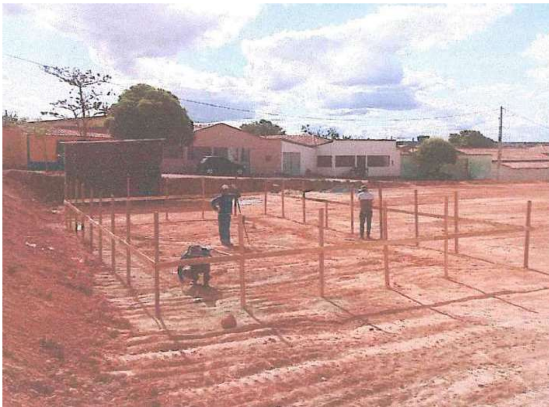
Foto 03 - Locação e gabarito do vestiário