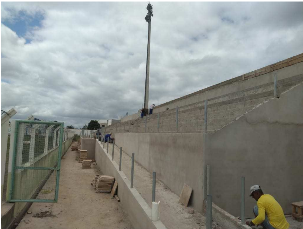
Foto 02 - Vista lateral direita da arquibancada