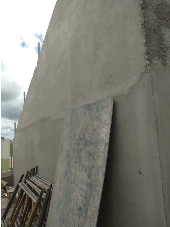
Foto 04 - Vista frontal da arquibancada