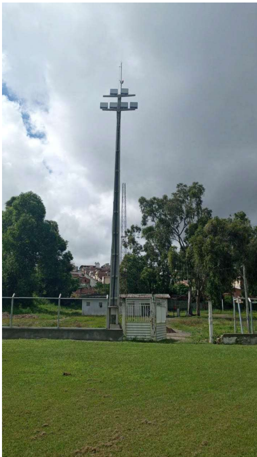
Foto 04 - Implantação dos postes de iluminação