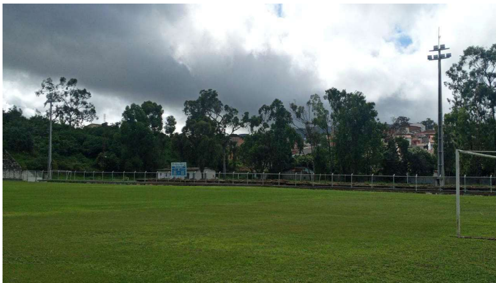
Foto 02 - Torre de iluminação em funcionamento