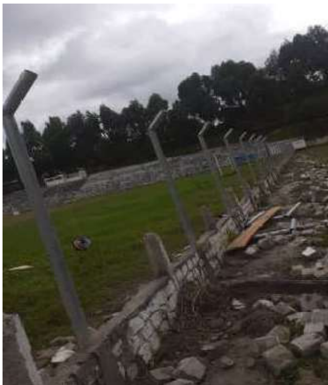
Foto 04 - Marcação de gabarito para levantamento de alvenaria