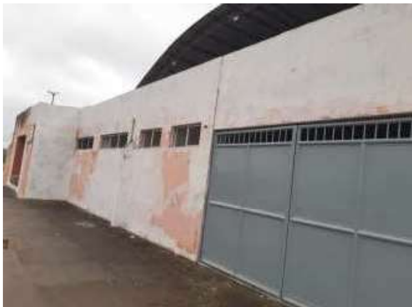
Foto 04 - Restauração dos sanitários