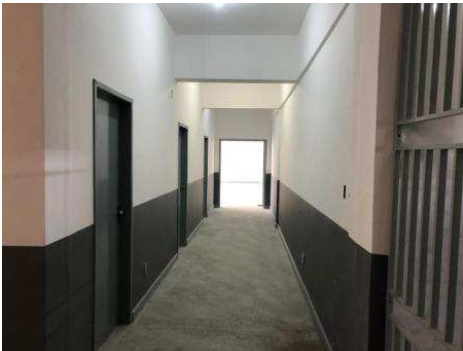
Foto 04 - Alambrado interno em construção