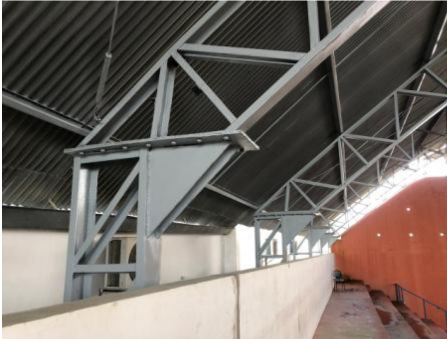
Foto 02 - Telhamento com telha de metálica