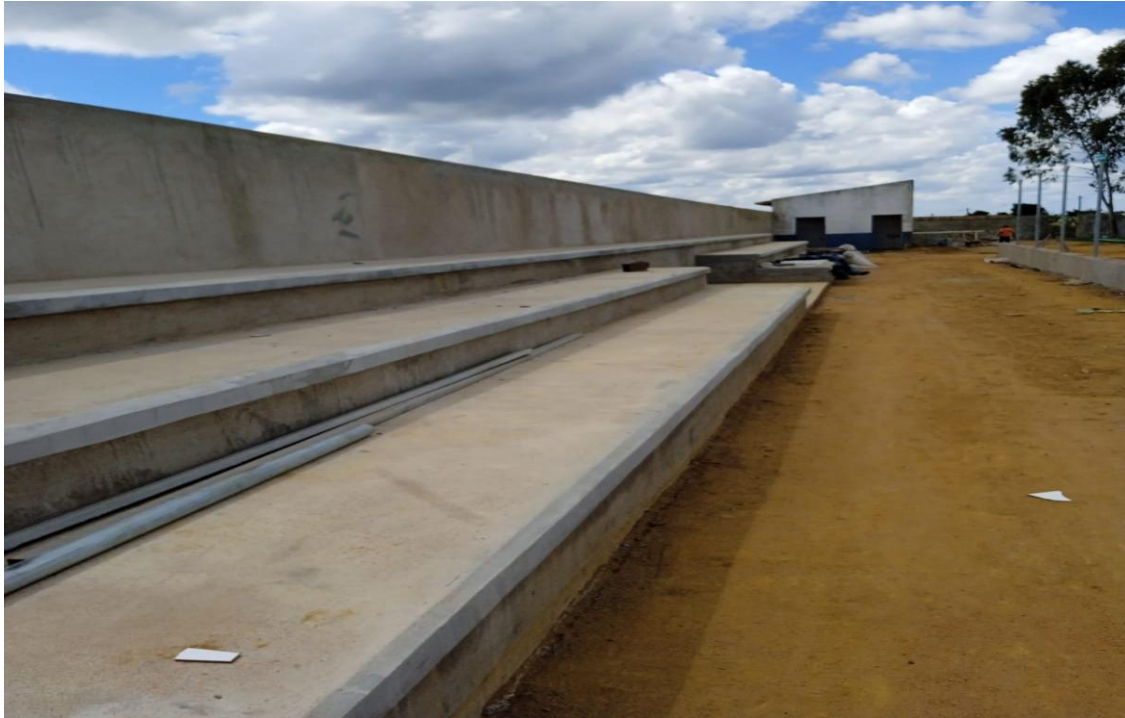
FOTO 04- POSTES E REFLETORES.