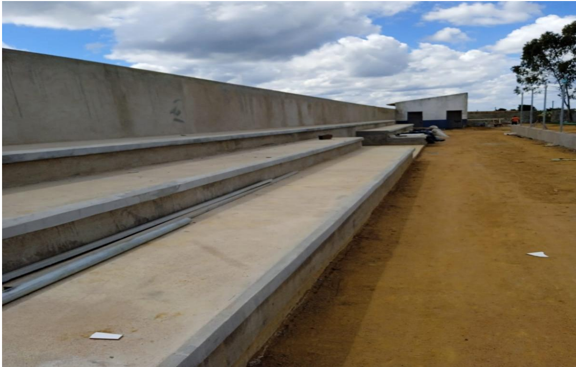
FOTO 04- POSTES E REFLETORES.