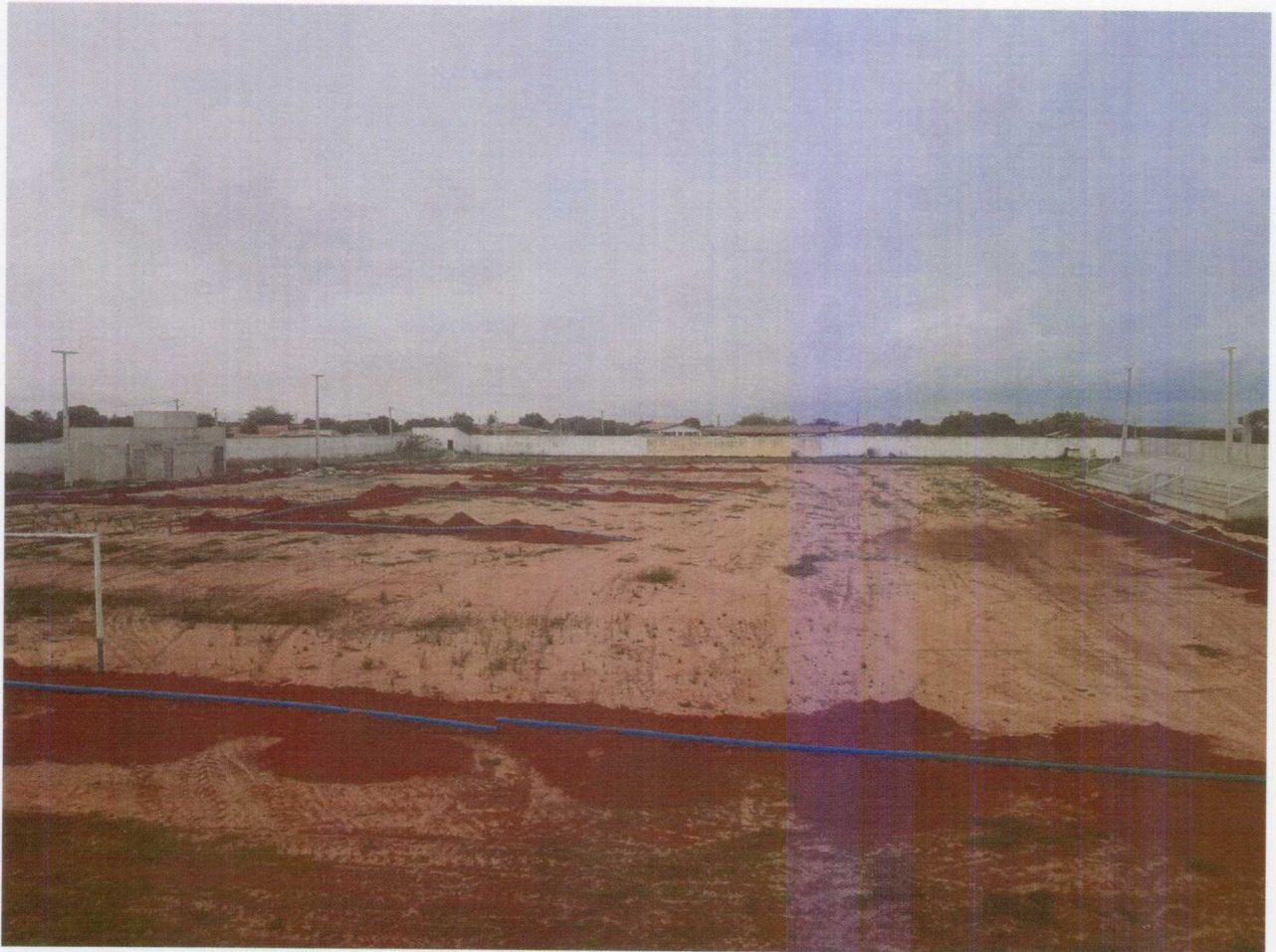
Foto 08 – Vista do Sistema de irrigação – instalação de redes e bomba e poço profundo.