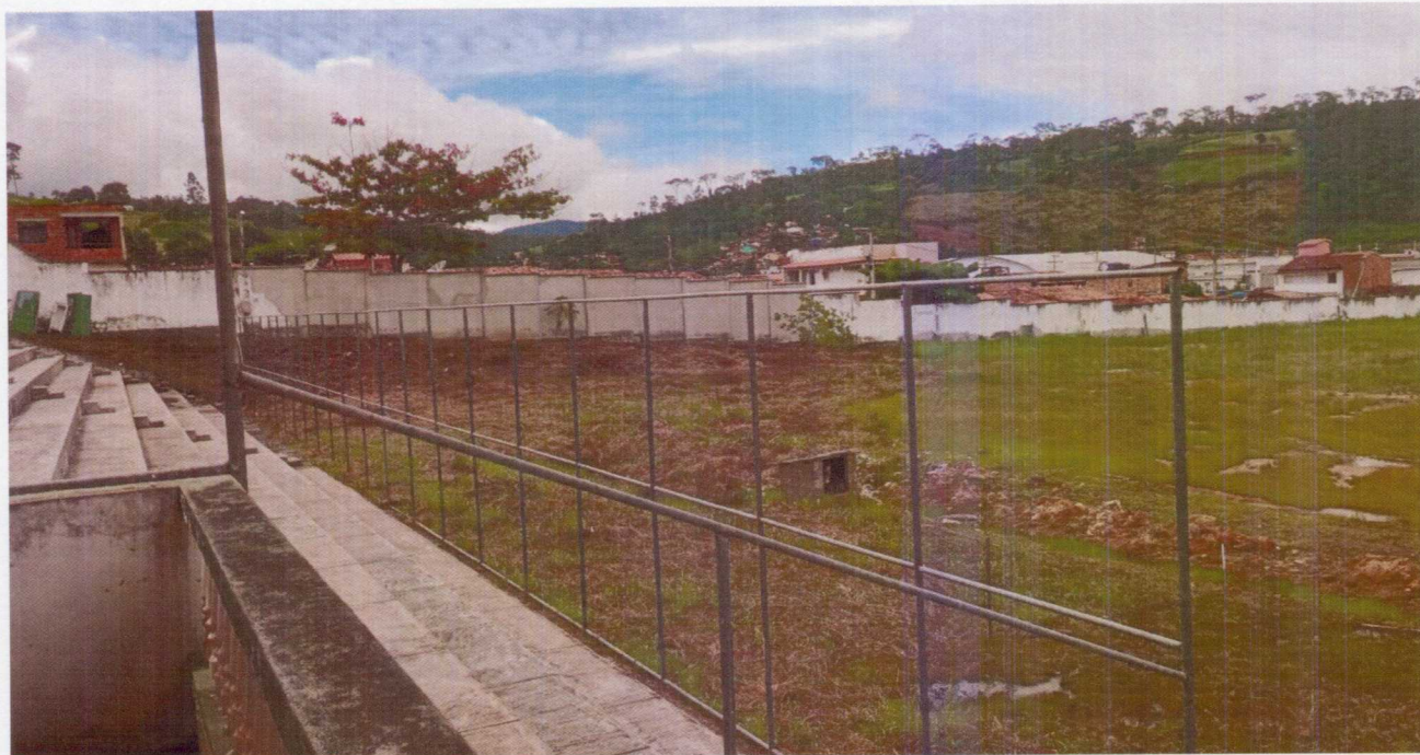
Foto 06 - Vista do Gramado