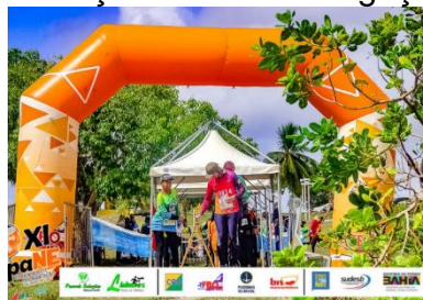
Toldo/ Área de distribuição