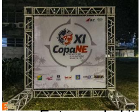
Entrega do kit