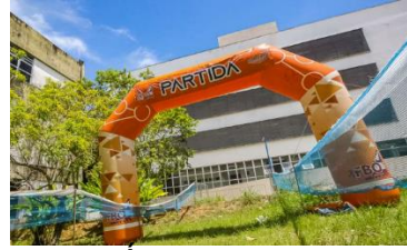
Área de concentração