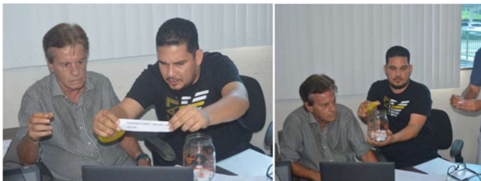
Sorteios das equipes