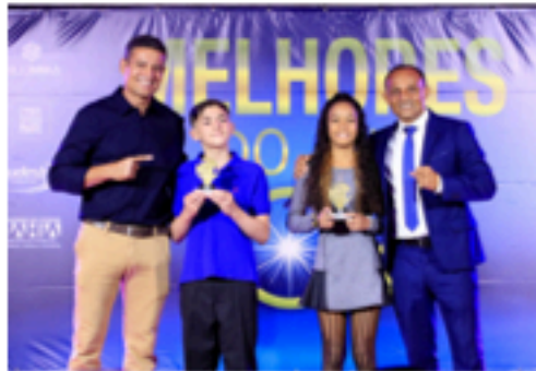
Premiação categoria infante juvenil