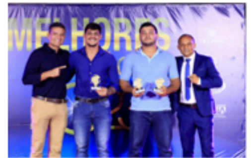
Premiação categoria adulto masculino