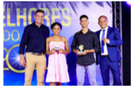
Premiação categoria juvenil