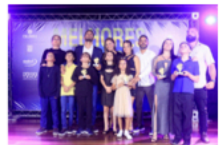
Premiação categoria infantil feminino e masculino