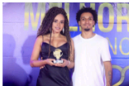
Premiação categoria adulto feminino