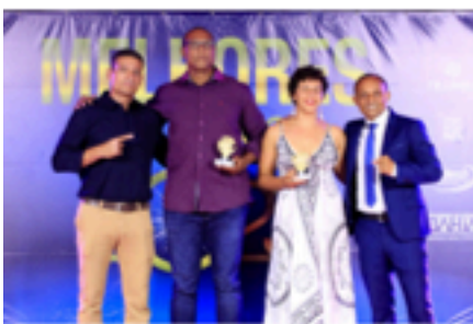
Premiação categoria master masculino e feminino