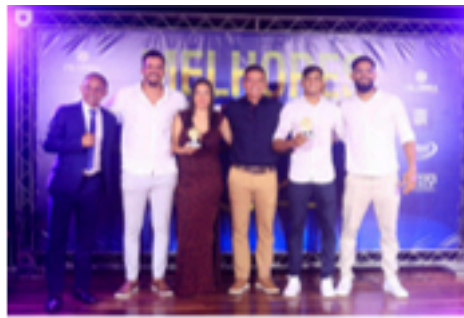
Premiação categoria adulto feminino e masculino